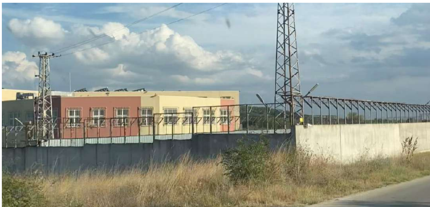
Figura 7: Pastrogor visto dall'esterno, la struttura è in tutto e per tutto una prigione.

Anche nei casi in cui sarebbe necessario farlo, le persone si rifiutano di mostrare e farsi curare le ferite procurate durante la cattura, per timore di subire ulteriori violenze a causa del regime di terrore instaurato dalle forze dell'ordine che operano nel campo e dalla polizia di frontiera incontrata sul confine.