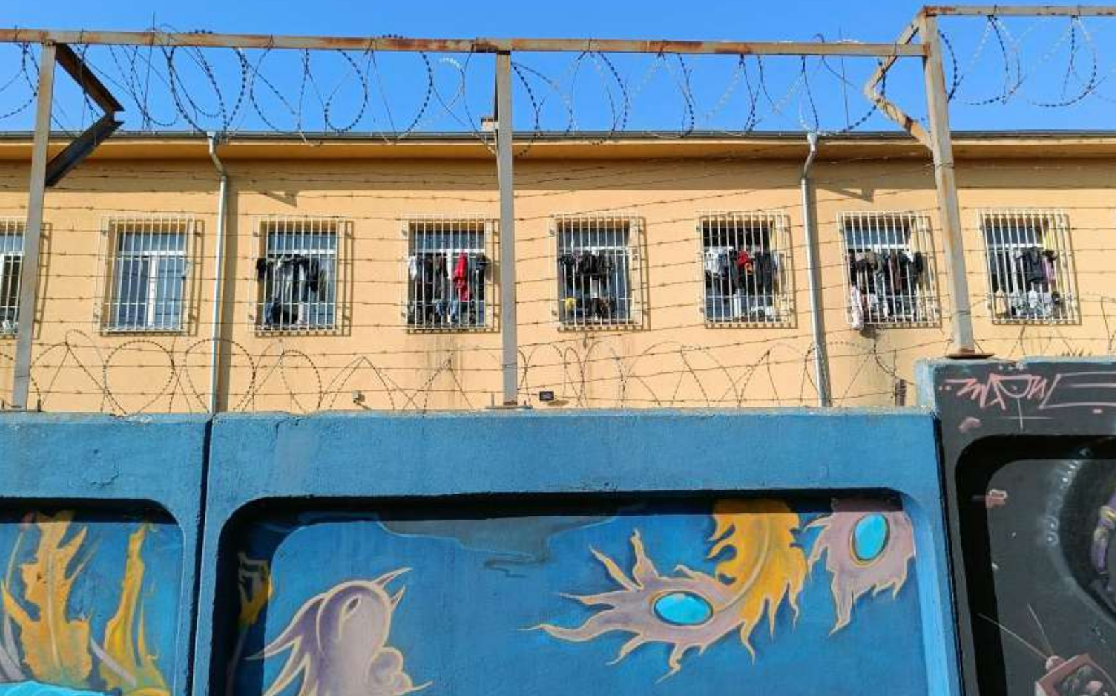
Figura 1: La struttura del campo di Harmanli vista dall'esterno

Le condizioni igienico-sanitarie del campo sono uno degli argomenti su cui la destra locale è riuscita a costruire, negli anni, una solida narrazione anti-migranti che fa presa non solo sui gruppi più nazionalisti e conservatori ma su un'ampia parte della popolazione locale. Nel 2016, durante il governo di Boïko Borysov 4 , una delegazione di cittadine di Harmanli chiese pubblicamente che il campo venisse chiuso paventando il diffondersi di malattie infettive tra la popolazione. Secondo alcune fonti 5 si trattava di un gruppo nazionalista guidato da Angel Dzhambazki e da altre personalità politiche note a livello locale. Angel Dzhambazki è co-fondatore del Bulgarian National Movement (VMRO), un partito di estrema destra ultranazionalista: nel 2013 fu indagato dalla procura distrettuale di Sofia per incitamento alla "discriminazione, violenza e odio su base razziale" 6 ma poi il procedimento venne archiviato. In quel frangente la SAR accolse le richieste dellə manifestantə e decise di mettere in quarantena l'intera struttura: scoppiò una violenta rivolta