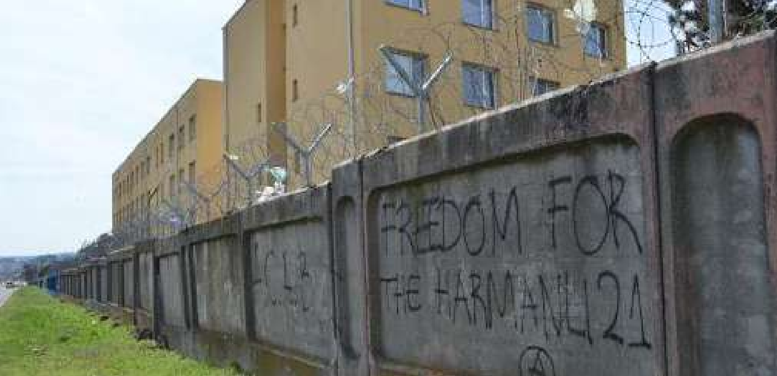
Figura 2: Il campo di Harmanli dall'esterno, La scritta "Freedom for the Harmanli 21" fa riferimento alle 21 persone che furono processate in seguito agli scontri del 2016.

soltanto famiglie, con anticipazione del coprifuoco alle 16 10 . Secondo Sakar News , dal 2013 ad oggi si sono succedute ben ventidue proteste, in media due all'anno 11 .