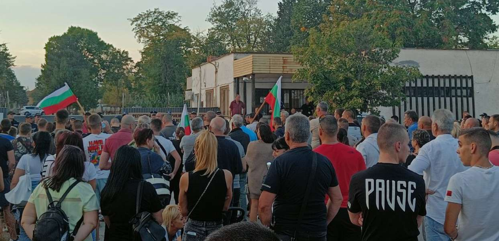
Figura 3: Manifestazione di fronte al campo di Harmanli, 27 settembre 2023.

Infine, un aspetto particolarmente critico riguardante le condizioni del campo di Harmanli è l'assenza di un'area protetta riservata alle minori. Secondo dati aggiornati al 20 giugno 2023 Harmanli ospita 276 minori di cui 81 non accompagnate. Questo dato racchiude, come abbiamo potuto constatare, molte bambine in età infantile oltre che adolescenti.