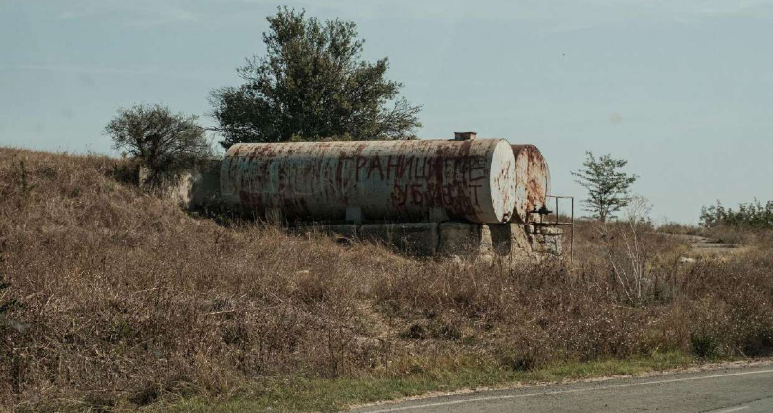
Figura 8: Scritta presente su due botti dismesse lungo la Route 79; la strada che corre parallela al confine sulla quale avvengono la maggior parte dei pushback.

Nella notte tra il 19 e il 20 luglio il Collettivo riceve la prima richiesta di soccorso da una persona che sta attraversando il confine turco-bulgaro. Si tratta di una donna incinta ferma a pochi metri dalla statale 79 insieme a due bambine, una di tre anni e una di sei 24 . È la prima volta che riceviamo richieste d'aiuto di questo tipo, prima di quella notte il nostro gruppo era impegnato in distribuzioni ed altre attività rivolte principalmente a chi aveva già trovato accoglienza all'interno dei campi citati. In effetti, la segnalazione arriva proprio da un residente del campo di Harmanli che è in contatto con il marito della donna.