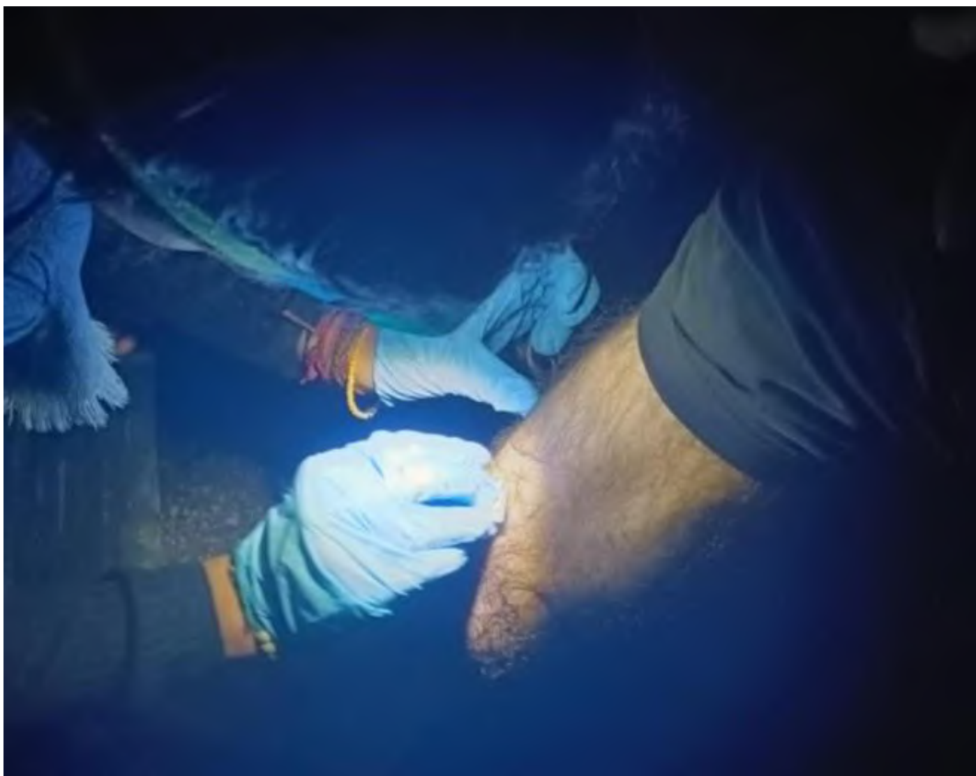
Figura 5: Momento di punto medico fuori dal campo di Harmanli. Le ferite più comuni sono pustole infette derivate dalla scabbia o dalle cimici da letto.

Sottolineiamo infine che il nostro lavoro di assistenza medica, svolto in strada con medicinali essenziali e limitatamente ai nostri mezzi, non poteva che garantire un servizio di bassa soglia; abbiamo intercettato le patologie più diffuse, malattie croniche o particolarmente gravi (come diabete, epilessia, malattie cardiache o degli organi dell'apparato digerente), per le quali le persone che sono venute a chiederci aiuto erano già in possesso di terapie e/o di medicinali somministrati in passato. Siamo però convinte che oltre le sofferenze più facilmente rilevabili ci sia un sommerso di vulnerabilità psichiatriche e psicologiche derivanti dalle condizioni di vita nei paesi di origine, dal vissuto del viaggio e dalla precarietà delle condizioni di vita nel campo. Questi bisogni, anche i più gravi e urgenti, non sono presi in carico da nessuno.