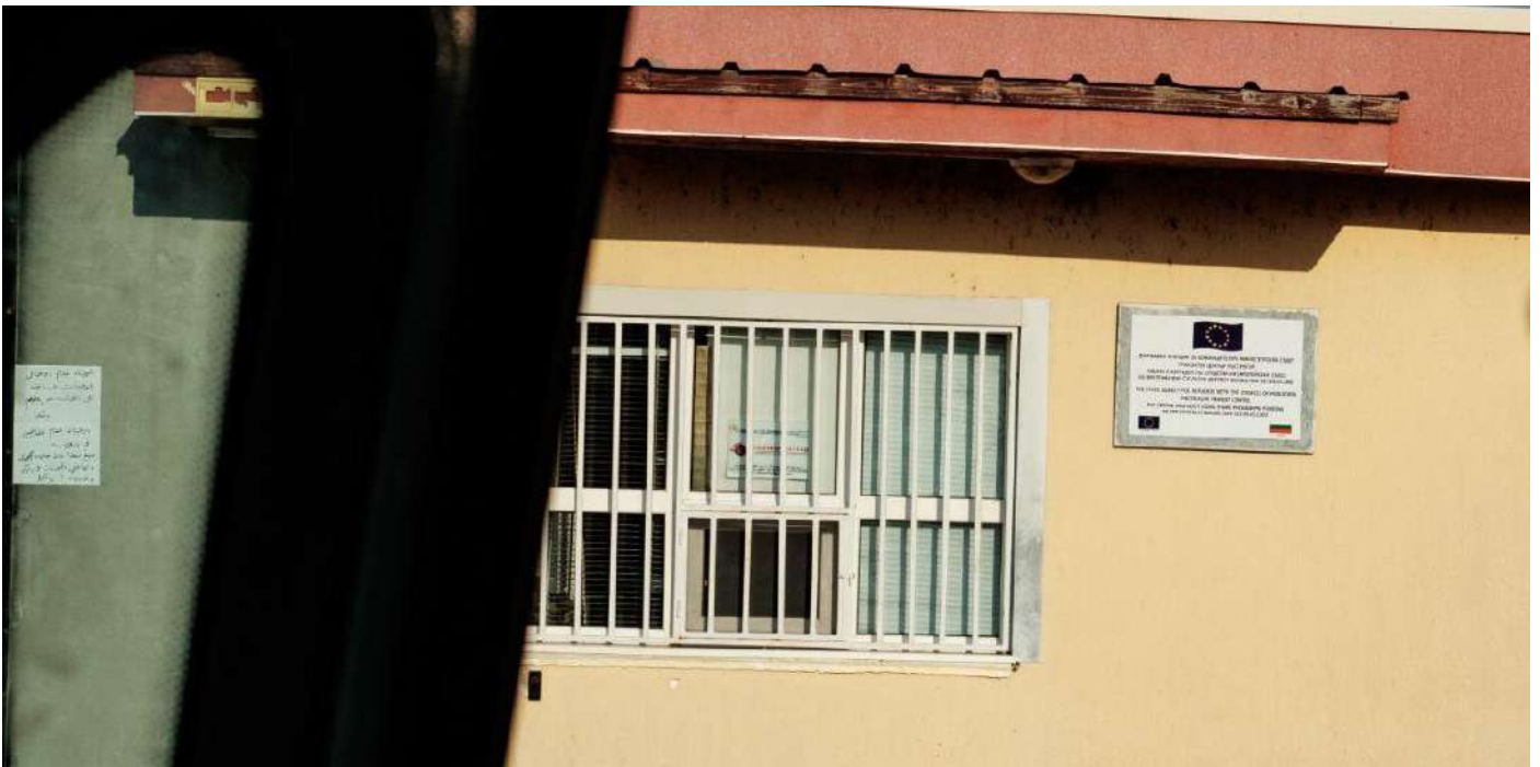
Figura 6: Ingresso del campo di Pastrogor. Sulla targa la bandiera dell'Unione Europea a indicare il finanziamento.

Incontriamo le persone residenti nel campo nella via principale di Svilengrad. Arrivano dal campo durante il giorno a piedi o con i taxi: nelle immediate vicinanze di Pastrogor, Svilengrad è infatti il più vicino centro abitato provvisto di servizi, dove le persone possono ricevere denaro e comprare il necessario per il game .