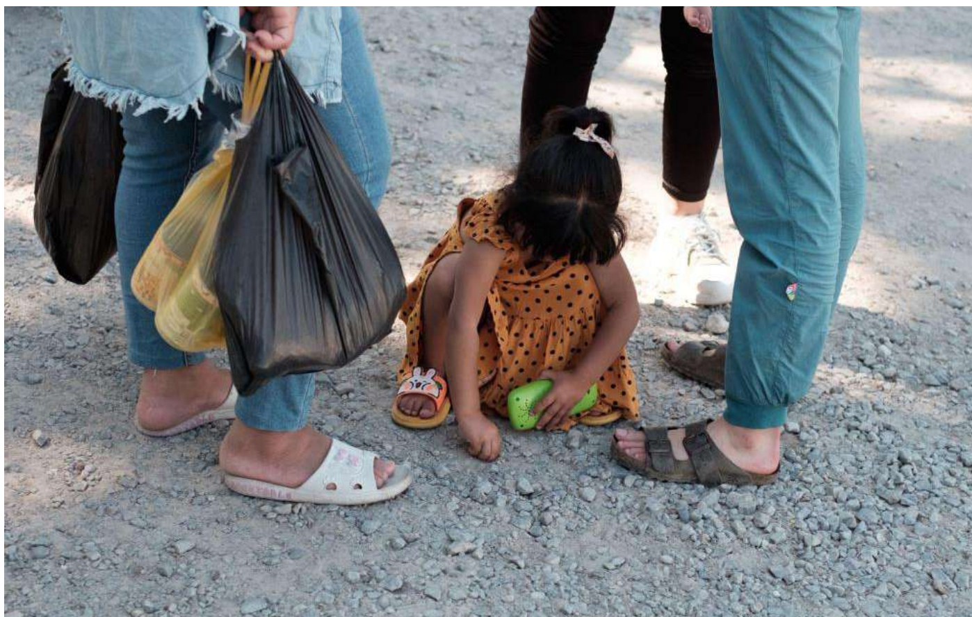
Figura 4: Momento di distribuzione di cibo 2.5 Assistenza medica

Stoviglie e pentole vengono lavate negli stessi bagni di cui abbiamo descritto le pessime condizioni igieniche. Il rischio di malattie infettive è altissimo. Questo come Collettivo ci siamo molto concentrate sulla distribuzione di cibo fuori dal campo: sacchetti individuali o per famiglie per cercare di dare un supporto basilare per potersi alimentare quanto basta da riuscire a riposare e poi, eventualmente, ripartire.