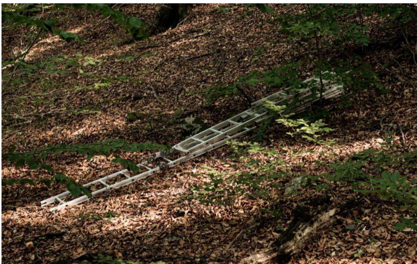
Figura 9: una scala metallica trovata nel bosco a poche centinaia di metri dal confine, nel lato bulgaro. Probabilmente abbandonata nel tentativo di portarla sulla fence per permettere a qualcuno di attraversarla