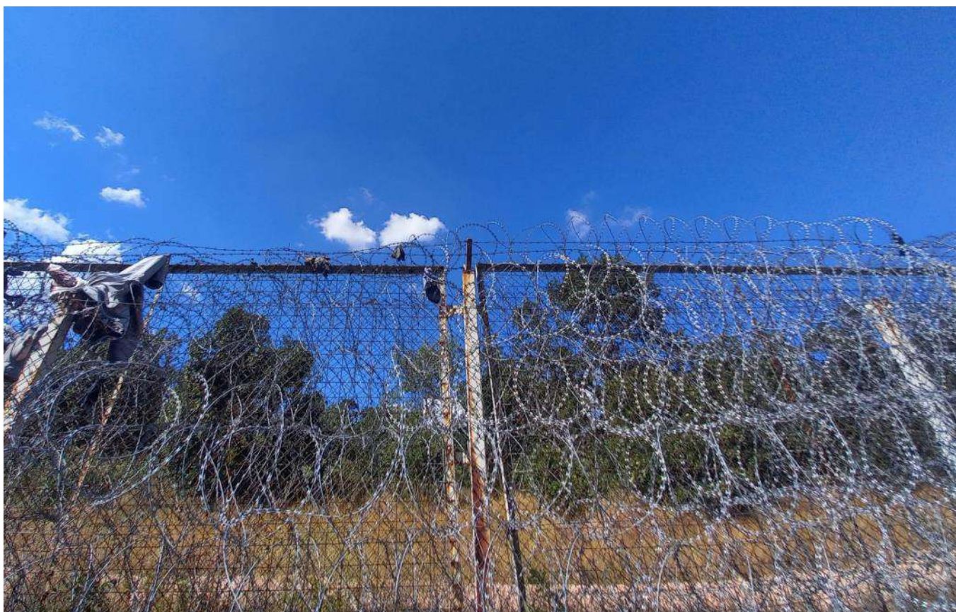
Figura 11: dei pantaloni rimasti incagliati nel filo spinato della fence che divide Turchia e Bulgaria. Alcune volte le persone si organizzano con delle scale o delle coperte per scalare la fence, altre volte usano i vestiti che hanno.

È un punto imprescindibile dell'agenda politica comunitaria, per il quale la Commissione Europea ha stanziato oltre 205 milioni di euro (225 milioni di dollari) 29 nell'ambito della nuova emissione di fondi per gli affari interni. Il sottotesto politico è l'obiettivo della Bulgaria di entrare nello spazio Schengen, obiettivo che potrà raggiungere più facilmente dimostrando di saper "gestire" quanto accade sui propri confini.